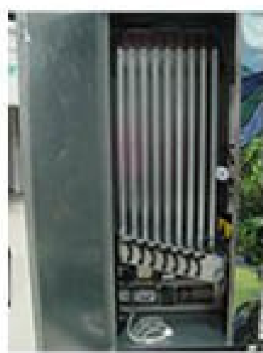
RESERVOIR FOR BOTTLES